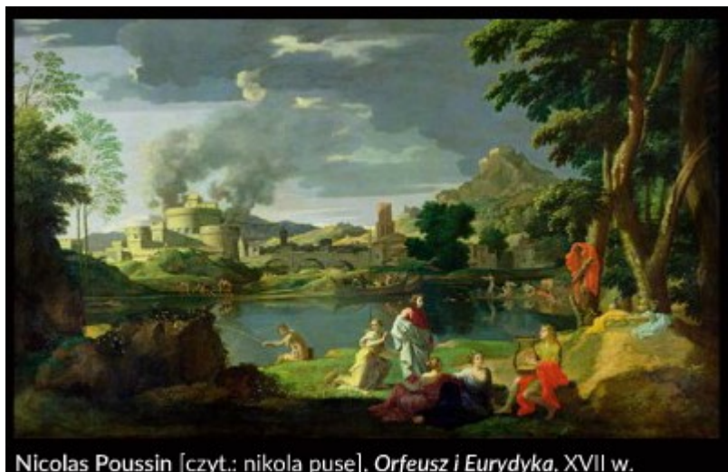
Nicolas Poussin [czyt.: nikola pusę], Orfeusz i Eurydyka , XVII w.