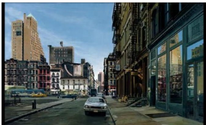
Richard [czyt.: riczard] Estes, Bar Baby Doll [czyt.: bejbi dol], XX w. Część artystów tworzy obrazy ludzko przypominające fotografie. Prezentowane na nich widoki wydają się samą rzeczywistością, istniejącą bez ingerencji twórcy.